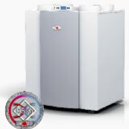
Comfort-Wohnungs-Lüftung CWL Excellent