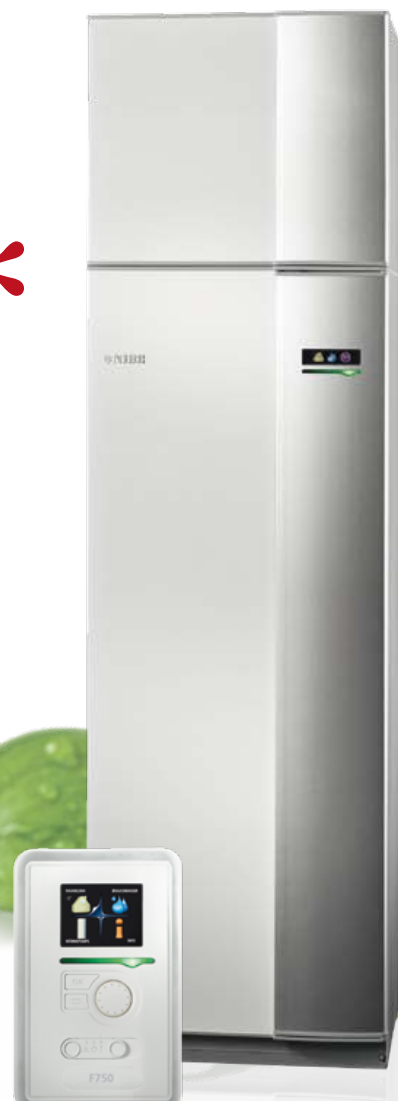
Farbdisplay für eine anwenderfreundliche und übersichtliche Bedienung