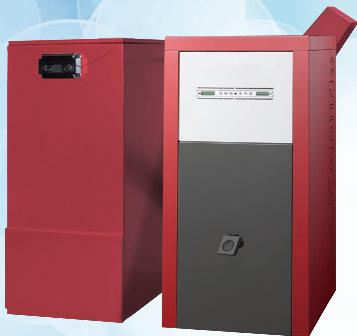
BEHÄLTER/TANK 250 kg - (60x67x132 h cm)